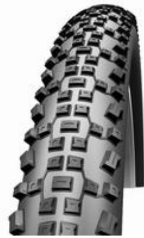
Dækket fra Swalbe - Racing Ralph

hvid staffage, men det gør heller ikke noget for det ser lækkert ud med den lidt kraftige tekst på siden.