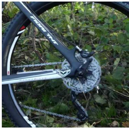
Bagtøjet er også fint forarbejdet og meget kompakt