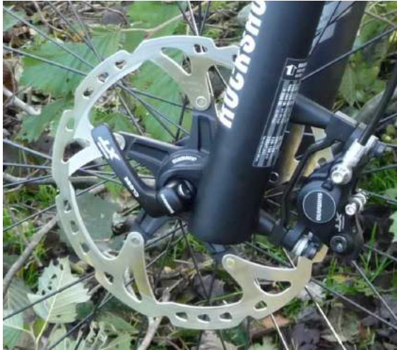
Pænt forarbejdet detalje ved forbremsen og quisk release.