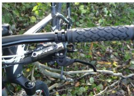
Pænt udført bremse og geargreb.

Som sagt så er rammen lavet af Carbon. modellen findes kun i sort med