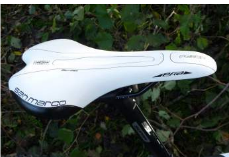
Saddelen en San Marco Era. En god sadel.

Jeg har lånt en Sensa Fiori TNT 29" PRO Custom af Futuresports, Hellestrup med en rammestørrelse på 19". Fiorien er Sensas topmodel. Rammen er lavet af Monococue Modular Carbon Fibre, med en luftaffjedret forgaffel fra RockShox med model nr. Reba RL 29" med 80 mm. vandring. Der er udløserdrej på højre gaffelben. Hvis