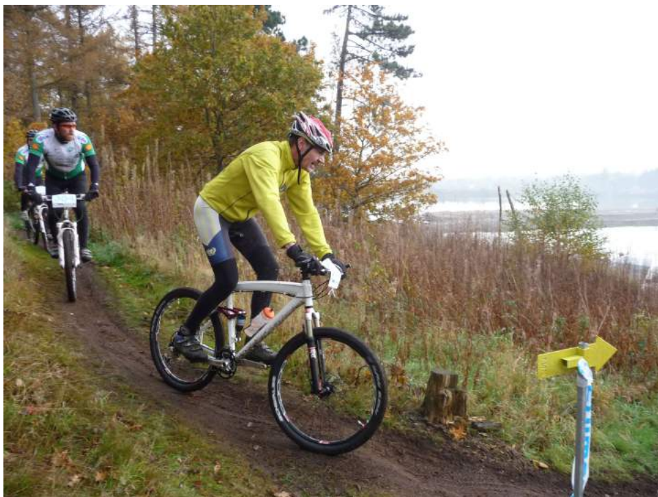
Stemmingsbillede fra WeBike Cup på Ibjerg, Årslev

FC-M770-LXT) fra Shimano er hul og med udvendige lejer. Jeg oplevede en meget bedre kraftoverførsel med udvendige lejer, end på min gamle med indvendige. Hjulene fra DT Swiss er dobbelt bundet. De 28 eger er dobbelt bundet dvs. at de er en smule tyndere på midten for bedre fleksibilitet, mindre vægt og større styrke. Gear og bremse gruppen er Shimano Deore XT. En gruppe der bare fungerer på pålidelighed og styrke. Næstbedste gruppe fra Shimano. Top swing forsifter, 27 gear med en kassette med 11-32 og Rapidfire Plus, så spiller det sammen.