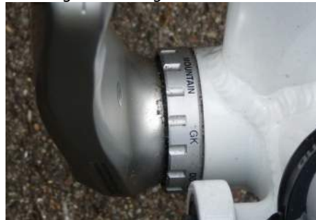
Krank huset med 170 mm krankarm

Rebound indstilles på den blå drejeknap. Der justerer man bagdæmperens hastighed ved tilbageslag, efter at den har været i aktion, sådan at baggaflen ikke rammer jorden med for høj kraft når dæmperen udløses for hurtigt. Lockout har også flere indstillinger ved at dreje på den røde drejeknap som foregår på en let måde, men stadig skal man have hånden væk fra styret, så den skal indstilles inden løbet. Den kan også indstilles til at dæmpe i forskellige hårdhedsgrader.