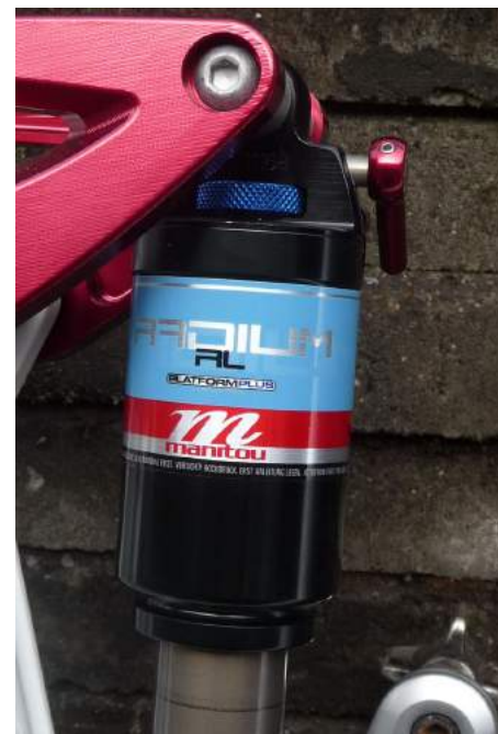
Bagdæmperen med de 2 indstillings muligheder

Hvis man kører freeride eller downhill er rebound en rigtig god ting, men til alm. Mtb løb er det måske skudt lidt over med den ekstra dæmpningsfunktion. Kranken med det mundrette navn (KRG