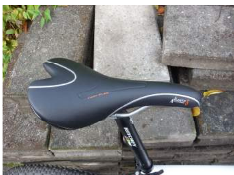
Saddelen Fi'zi:k Alliante Delta, en forholdsvis blød sadel, men perfekt til min bagdel.