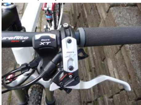
Detail billede fra styret

FC-M770-LXT) fra Shimano er hul og med udvendige lejer. Jeg oplevede en meget bedre kraftoverførsel med udvendige lejer, end på min gamle med indvendige. Hjulene fra DT Swiss er dobbelt bundet. De 28 eger er dobbelt bundet dvs. at de er en smule tyndere på midten for bedre fleksibilitet, mindre vægt og større styrke. Gear og bremse gruppen er Shimano Deore XT. En gruppe der bare fungerer på pålidelighed og styrke. Næstbedste gruppe fra Shimano. Top swing forsifter, 27 gear med en kassette med 11-32 og Rapidfire Plus, så spiller det sammen.