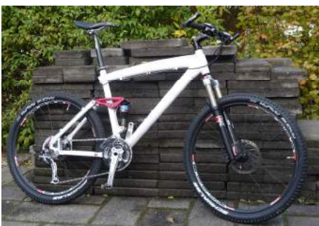
Skøn at skue, nem at holde af.

Det bliver med en smule vemod i mit gamle hjerte at cyklen skal afleveres igen.